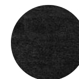
Teppiche Oria Ø 250 cm