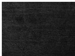
Teppiche Oria 400x300 cm