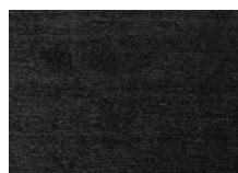
Teppiche Oria 350x250 cm