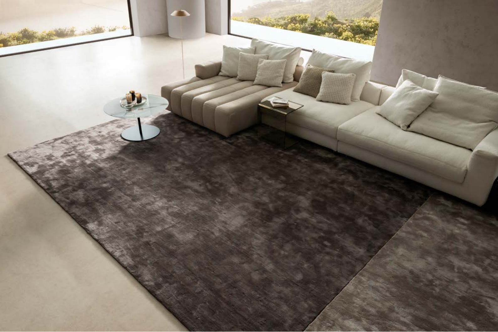
Modell: Teppich „Sense“, 400x400 cm und 100x400 cm Farbe: Graphit (links) und Silver (rechts)