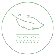
Sanft zur Haut

Weiters sind Tencel® -Fasern äusserst farbecht, robust, atmungsaktiv, hautfreundlich, Milben- und Bakterienresistent sowie vollständig biologisch abbaubar.