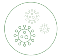
Geringes Bakte- rienwachstum