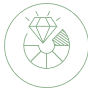
Hohe Farb- beständigkeit